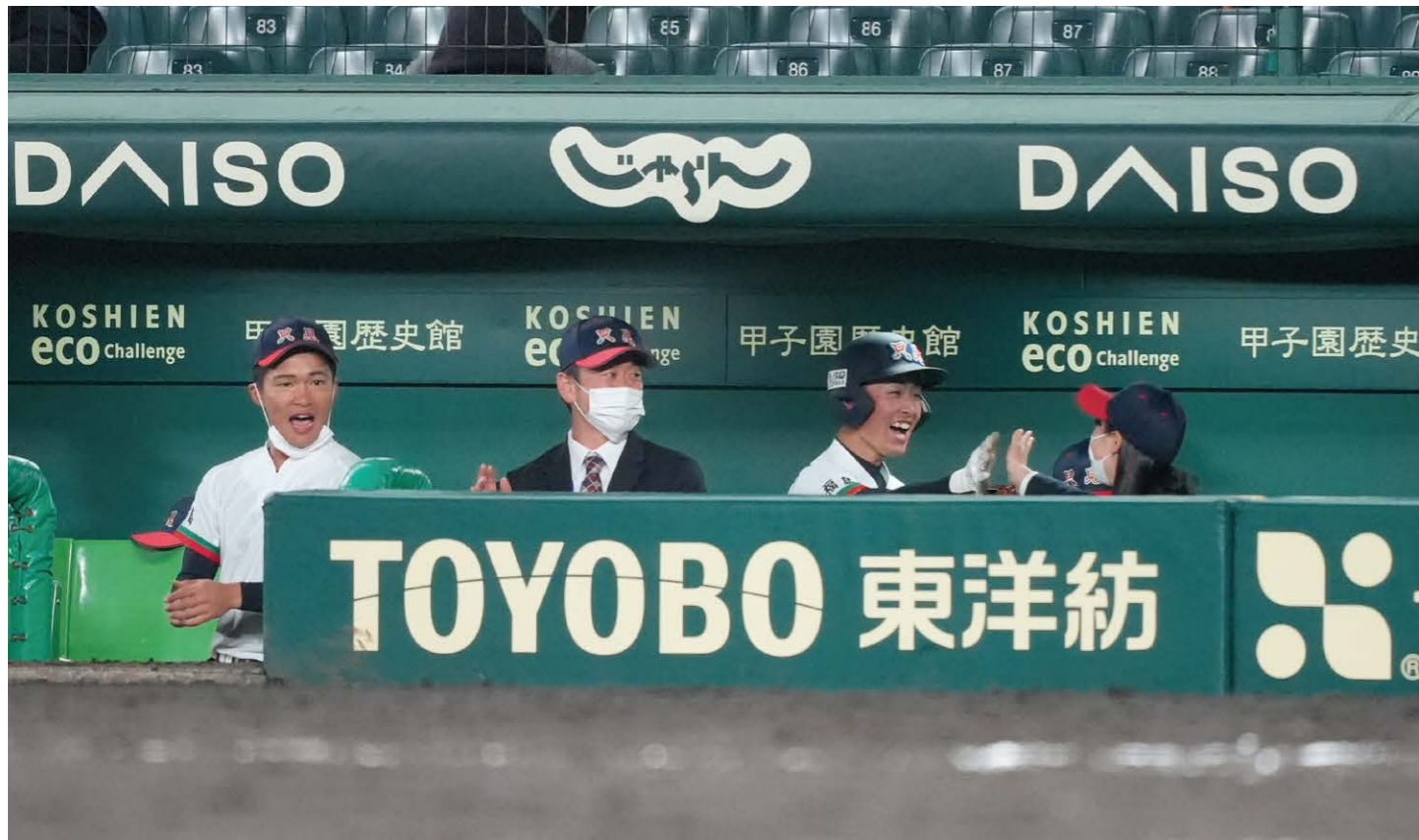
初得点の喜びを分かち合うベンチ