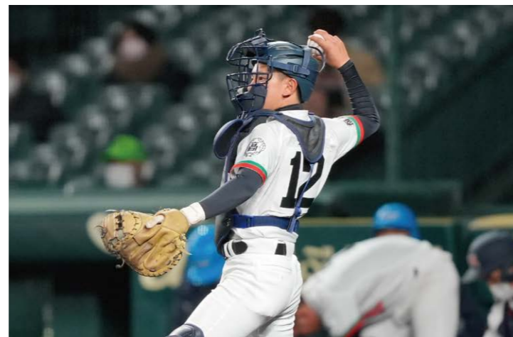
反撃ムードを後押しする羽染