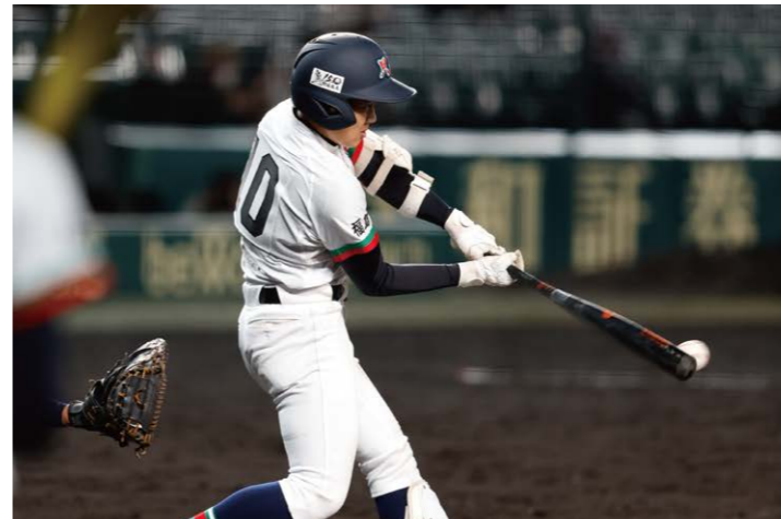
只見高校2本目のヒットは、猪俣から