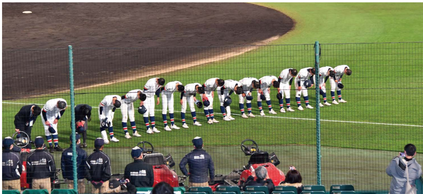
全力疾走を果たした只見高校ナイン!感謝の意を込めて全国からの応援団にあいさつ