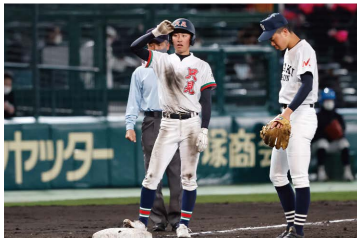
4回裏、ツーアウト1塁、3塁 只見高校最大のチャンスが訪れる