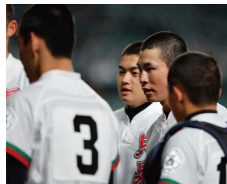
長谷川監督の指示のもと反撃開始!