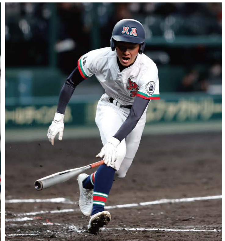
4回裏、四球を選びチーム初出塁