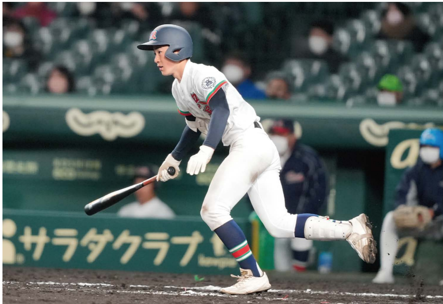
4番室井も必死に食らいつく