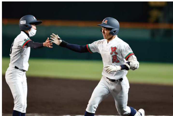
初めてのランナーを2塁まで送り、